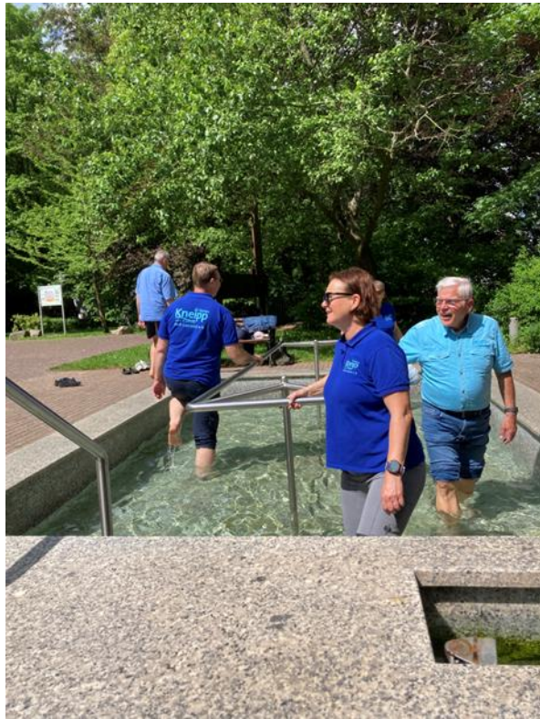
Kneippverein Bad Tabarz/Brotterode